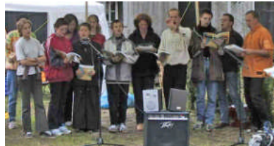
„Little Light of L.E.“ Damals und Heute

Wir freuen uns auf ein großartiges Konzert und laden Sie alle ganz herzlich dazu ein.