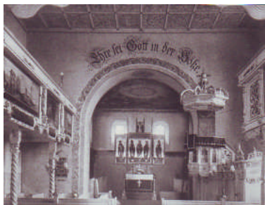
Innenansicht um 1920

Die Theklaer Kirche hoch auf dem Berg hat eine beherrschende Wirkung, ihrem Eindruck - würdevoll und etwas trutzig - kann sich niemand entziehen. Die sich in der Nähe befindlichen Kirchen in Panitzsch und Beucha ähneln ihr, deshalb werden sie im Volksmund auch „die drei Hohepriester“ genannt. Das genaue Datum für den Bau der Theklaer Kirche ist unbekannt. Aufgrund von Merkmalen, wie Findlingsbau mit bis zu 2 m starken Wänden, viereckiger Altarraum, viereckiges Kirchenschiff und viereckiger Turm ohne Eingang, wird die Entstehung zwischen 900 und 1100 angesetzt. Auf einer der beiden Holzsäulen, die nach dem Brand 1959 in der Kirche errichtet wurden, wird das Entstehungsdatum mit 1050 beziffert. Sie ist damit die älteste Kirche Leipzigs. Ihren Namen verdankt sie dem Dorf „Techele“. Die Berganlage, die auch dem Schutz der von Halle über Taucha nach Püchau führende Salzstraße diente, wurde Hohentichel oder Hohentechel genannt. Die Theklaer Pfarrrer betreuten bis ins 19. Jh. neben den Dörfern