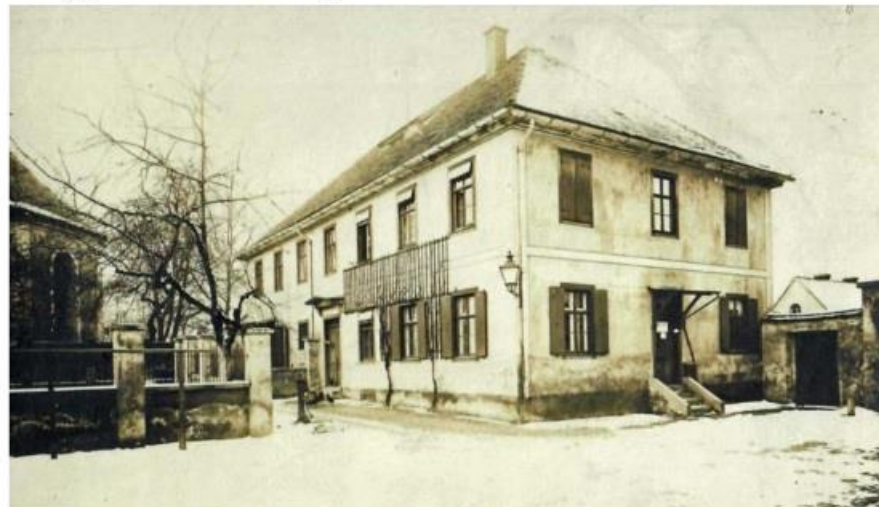
Pfarrhaus Schönefeld vor 1906 (Ansicht von Südosten), - Eingang zum Pfarrhaus an der Südseite, Publikumseingang (Expedition), an der Ostseite - Wirtschaftshof mit Kopfsteinpflaster und Handschwengelpumpe, - Trennungsmauer zwischen Wirtschaftshof und Pfarrgarten

1906 wurden sämtliche Pfarllehnsfeld- und Wiesengrundstücke an die Mariannenstiftung in Schönefeld verkauft. Damit waren die landwirtschaftlichen Gebäude des Pfarrhofes überflüssig geworden und konnten abgebrochen werden.