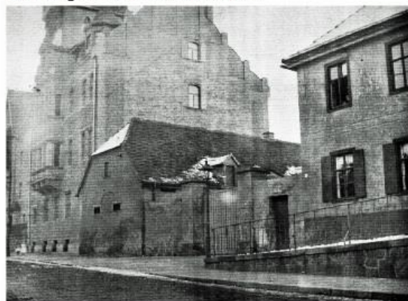
Wirtschaftsgebäude der Pfarre Schönefeld (Ansicht von der Hauptstraße aus).

Beide Bauwerke, Kirche und Pfarrhaus, stammen aus den Jahren 1820 bzw. 1822. Die Vorgängerbauten waren im Verlauf der Völkerschlacht 1813, ebenso wie das ganze Dorf Schönefeld, weitgehend zerstört worden. Über die Pfarre vor der Zerstörung wissen wir wenig; nur, dass mehrere Personen zu der Pfarrwirtschaft gehörten. Die Pfarrstelle war ursprünglich mit einer kleinen Landwirtschaft verbunden, deren Erträge für den Unterhalt des Pfarrers bestimmt waren und die die Reit- und Kutschpferde zu stellen hatte, die der Pfarrer zu Besuchen bei weit entfernten Filialen brauchte. Einziges Überbleibsel des alten Pfarrhauses ist das Tonnengewölbe aus Findlingen und Bruchsteinen, west-östlich gerichtet, das einen Teil des heutigen Pfarrhauses unterkellert.